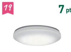
19 7 pt 日立照明