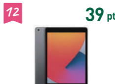
12 39 pt アップル タブレット