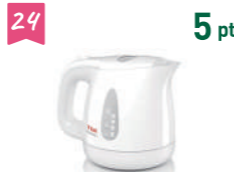
24 5 pt ティファール 電気ケトル