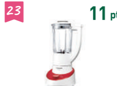
23 11 pt パナソニック ミキサー