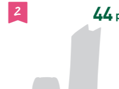
2 44 pt 某人気ゲーム機本体 ※入手出来次第の発送となります