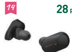
14 28 pt ソニーヘッドホン