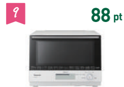
9 88 pt パナソニック 電子レンジ