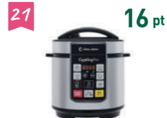
21 16 pt ショップジャパン 圧力鍋