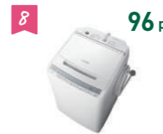
8 96 pt 日立洗濯機