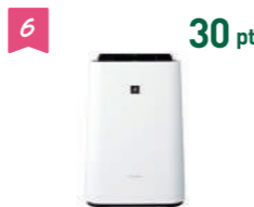
6 30 pt シャープ加湿空気清浄機