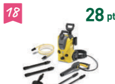
18 28 pt ケルヒャークリーナー