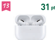
13 31 pt アップルヘッドホン