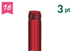
16 3 pt サーモス 水筒