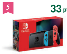
5 33 pt 任天堂 Nintendo Switch 本体 ※入手出来次第の発送となります