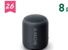
26 8 pt ソニースピーカー

※期間中に弊社にて、売買価格1000万円以上の土地・中古一戸建・新築一戸建・マンション等を購入し、弊社規定の手数料をお支払い頂いたご購入者が対象となります。(収益物件・事業者様を除きます) 例)2,000万円(税抜価格)の新築一戸建を株式会社リヴの仲介でご購入頂いた場合、購入時手数料(税抜)の10%に相当する66ポイント(1ポイント=1000円相当)のリヴポイントを進呈いたします。 ※商品写真はイメージです。内容が変更になる場合がございます。ご了承ください。 ※アイテムは予告なく変更となる場合がございます。