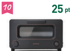
10 25 pt バルミューダ トースター