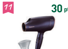
11 30 pt パナソニック ドライヤー