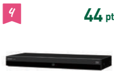
4 44 pt シャープ BDレコーダー