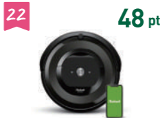
22 48 pt アイロボット クリーナー