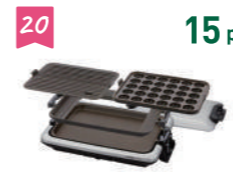
20 15 pt タイガーホットプレート