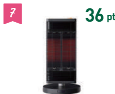
7 36 pt ダイキン電気ストーブ