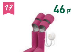
17 46 pt パナソニック 健康器具