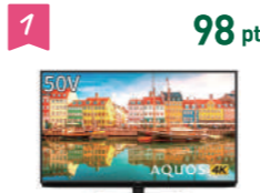
1 98 pt シャープ 4Kテレビ