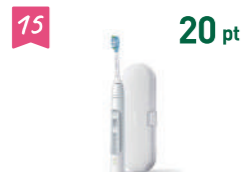
15 20 pt フィリップス 電動歯ブラシ